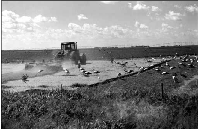
Abb: 3 Rastende Weißstörche in Botswana

Auch Schreiadler bevorzugen Rastaufenthalte in Gebieten mit einem höheren NDVI, allerdings sollten diese Ergebnisse mit weiteren Telemetriedaten untermauert werden. So konnte lediglich eine Tendenz zu verlängerten Aufenthalten in Gebieten mit höherem NDVI beobachtet werden.